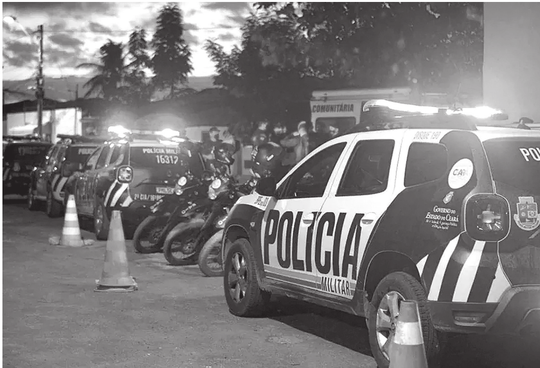
Segurança no Ceará é insatisfatória, de acordo com Elmano de Freitas

rior Norte do Ceará, também foi apresentado aumento no mesmo recorte temporal. Os registros apontam que janeiro de 2025 terminou com 195 casos na região, enquanto em dezembro de 2024 foram apresentados ao final do mês 178 casos de CVP. A única região apresentada pelo relatório que demonstrou diminuição nos casos foi na Região Sul do Estado, em dezembro de 2024 foram 178 casos e em janeiro de 2025 os números apontam 164 casos.